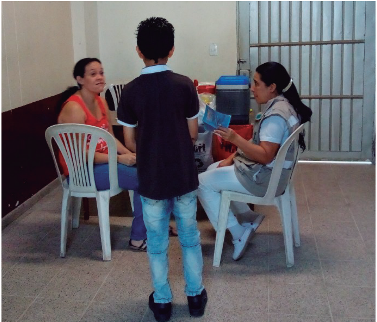
Jornada de vacunación, 27 de enero de 2018.