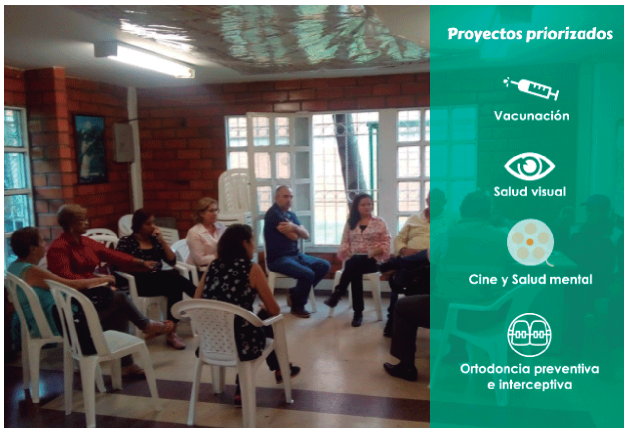
Socialización del proyecto Salud visual. Comuna 12

También en la comuna 12, la Ex Comisión de Salud, implementando algunos cambios, y bajo otra figura, seguirá velando por el bienestar de los habitantes de La América.